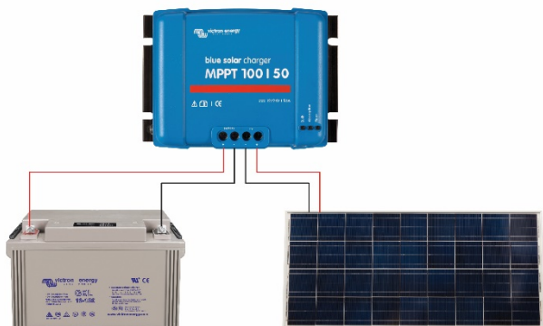
Figure 1: Power connections